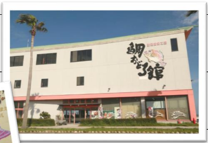
鯛おどる館 かまぼこイメージ

【淡路島の生しらす丼 島内売上No.1】を誇る『道の駅あわじ』で、団体のお客様だけが召し上がっていただける生しらすメニューです。たっぷりの地元産“生しらす”と、玉ねぎなどの名物食材の組み合わせで淡路の味覚をご堪能いただけます。春~10月頃まで予定